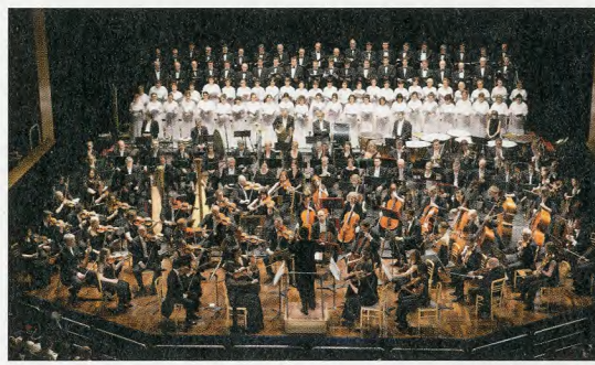
▲ Clausura de la 50 Semana de Música Religiosa de Cuenca con la Orquesta Hallé de Manchester, el 24 de abril. La obra, expresamente seleccionada para este domingo de resurrección, fue la Sinfonía nº 2 de Mahler, también rebautizada como Resurrección, que fue dirigida por Christian Mandeal.