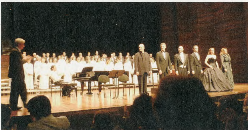
▲ Participación en el ciclo de Ópera y Música Vocal de la capital leonesa, el 6 de mayo.