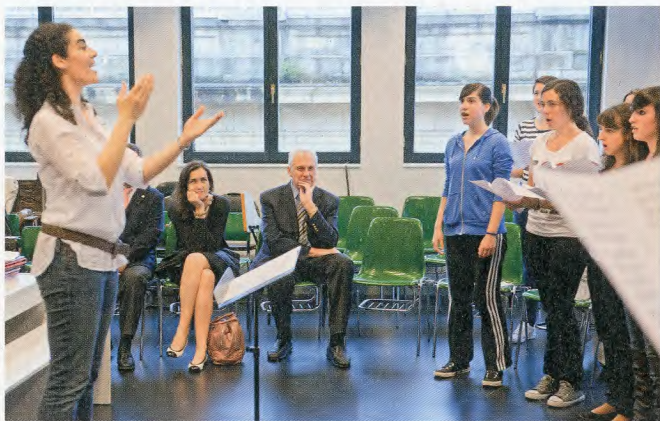
▲ La ministra de Cultura, Ángeles González-Sinde, tuvo ocasión de escuchar al Orfeoí Gazte y de asistir a un ensayo del Orfeón durante su visita a la sede del coro, el 6 de junio.