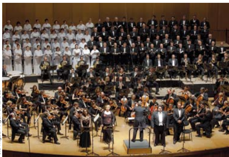
Concierto en el Palacio de la Ópera de A Coruña.

Noticias del Orfeón Donostiarra / Donostiako Orfeoaren berriak