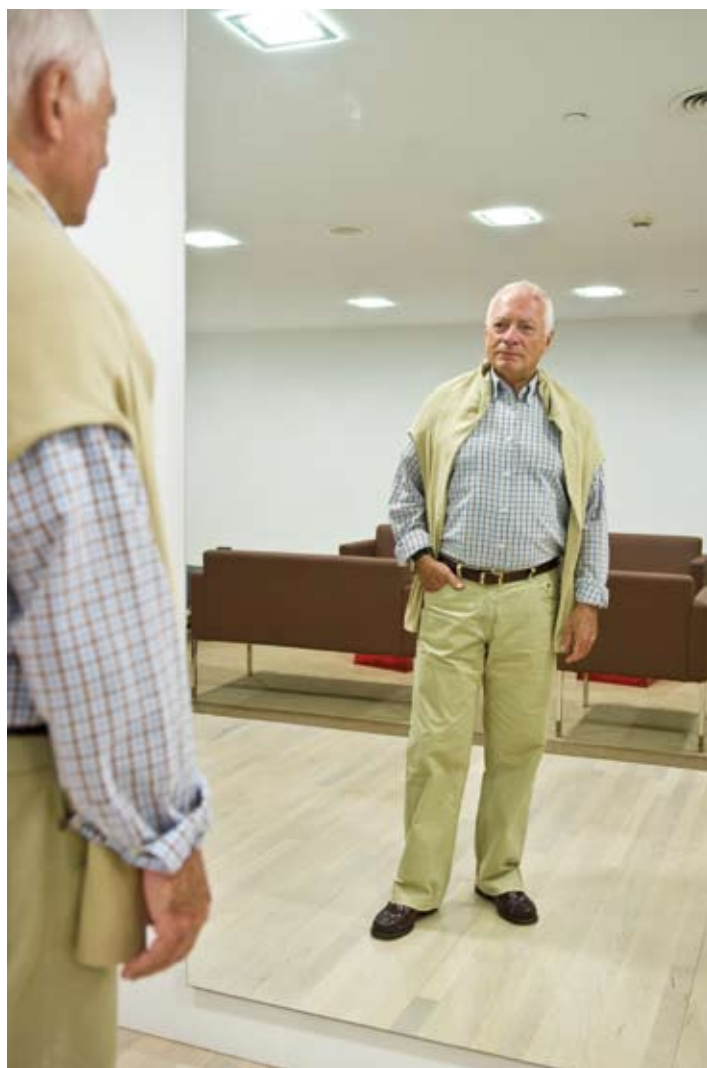
El director, antes del ensayo en el Kursaal. Debajo, su dedicatoria al coro.

Para este compatriota de Mozart, a quien le gustan los compositores alemanes del primer romanticismo, como Schumann o Mendelssohn “porque sus composiciones son muy puras”, e incluso Wagner, “aunque sea totalmente distinto en cuanto a las emociones”, la Novena de