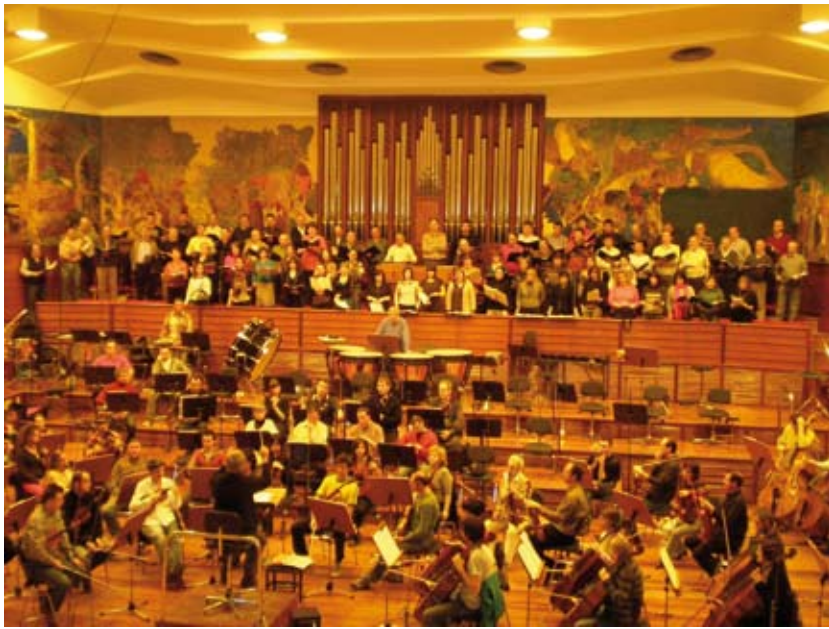
Grabación del CD "Canciones del mundo", integrado por trece temas que junto a la OSE ha realizado el coro para el sello de RTVE.