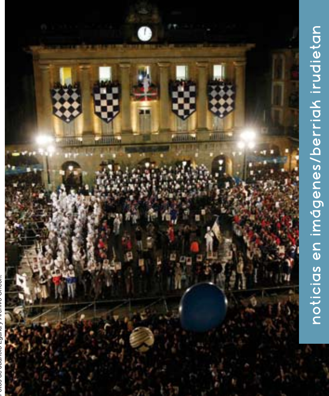
Orfeoiak San Sebastian martxa interpretatu zuen bandera igotzen den gauetan.