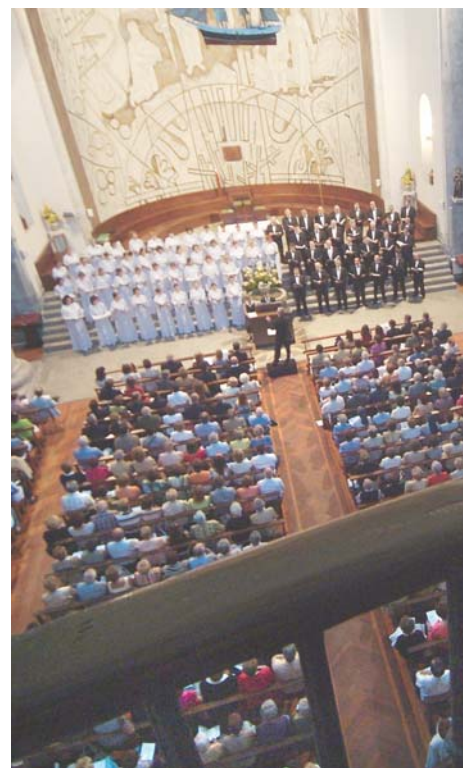
Concierto en Mutriku.