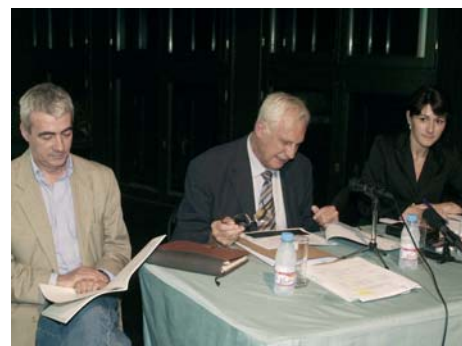
El director, el presidente, y la secretaria general.

Uztailaren 4an egin zen ohiko Batzar Nagusia. Bertan aurkeztu zitzaizkien orfeoilariei 2004ko Memoria, kontuen egoera, aurreko ekitaldiaren balantzea, eta hurrengo urterako aurrekontua. Oraingo honetan, ez zen Zuzendaritza Batzordeko kiderik berri behar.