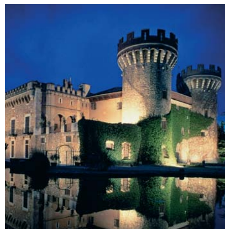
Castillo de Peralada.

Se interpretará la 8ª de Mahler junto a la Sinfónica de Galicia, bajo la dirección de Víctor Pablo Pérez.