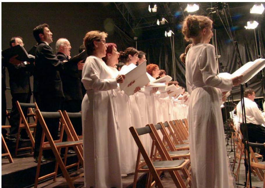
Concierto en Salamanca.

A mediados de julio, Alcalá de Henares celebró el cuarto centenario del Quijote y en Salamanca el 250 aniversario de su Plaza Mayor y ambas ciudades quisieron conmemorar estos hechos histórico-culturales con un programa de óperas interpretado por el Orfeón y la Sinfónica de la región de Murcia bajo la dirección de Sáinz Alfaro. El día 16, el Parque O'Donnell de Alcalá se transformó en auditorio al aire libre para que sus vecinos pudieran escuchar los fragmentos de ópera de Verdi, Mascagni y Borodin programados. El concierto de Salamanca se celebró al día siguiente en el Centro de Artes Escénicas y de la Música con el mismo repertorio.