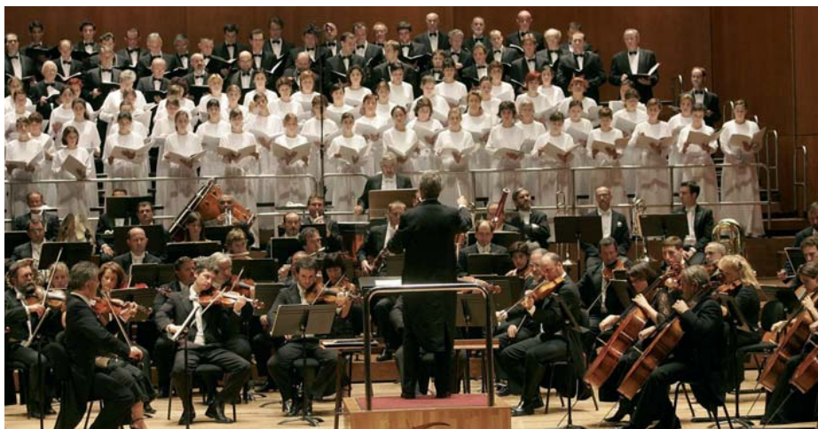
El Orfeón y la OSE en el Euskalduna de Bilbao.