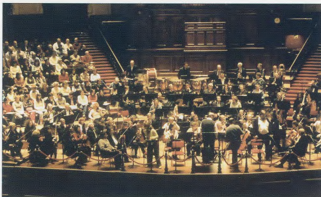
Utrechteko Auditorioko Kontzertua

Orfeoiak 2004an nazioartean egin zituen irteeren artean, Holandako Haga, Utrecht eta Amsterdam hirietan eginiko bira izan zen azkena. Bere bizitzako lehen ehun urteak ospatzeko antolatutako programan, Hagako Egoitzako Orkestrak Orfeioa gonbidatu zuen Verdiren Requiem Meza interpretatzeko, eta lau kontzertu eman zituen koruak. Sarrerak agortu egin ziren aste batzuk lehenago, eta Holandako egunkarietako kritikek aditzera eman zuten emaldi horien arrakasta.