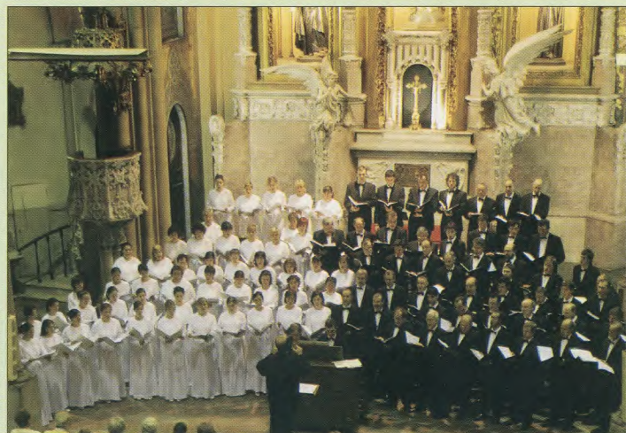
La iglesia de los Jesuitas de Donostia celebró su centenario con un concierto del Orfeón

dohainik eliza horretan irailaren 17an. Kontzertu hori bera eman zuen hurrengo egunean Bergarako San Pedro elizan.