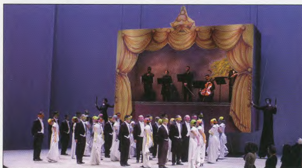
"Un ballo in maschera" opera, Donostiako Musika Hamabostaldian Kursaal Auditorioan antzestua.