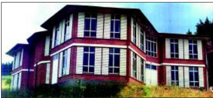
Antiguo Edificio del Centro Enseñanzas Artesanales. Polígono Agirretxe 1985.