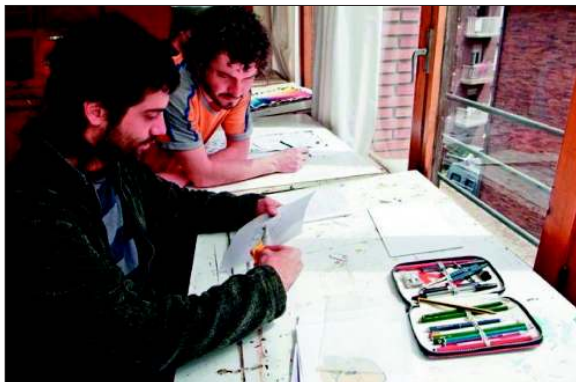
Clase de diseño. 2007.

La Historia del Arte entendida no como acumulación de datos y nombres, de fechas y conceptos fuera del mundo real del alumno. La Historia del Arte como una sucesión más o menos lógica y contextualizada, donde se entiende y comprende las motivaciones principales y generales de la evolución artística de la humanidad. Muy visual, donde la parte fundamental es la audiovisual y los ejercicios como una auto-comprobación de los temas estudiados.