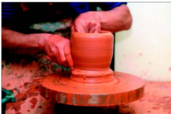
Cerámica. Torno. 2005.

Este taller esta dividido en las siguientes secciones: Modelado de arcilla en todas sus especialidades comunes, torneado y retorneado (sección alfarería), preparación de las capas vitrificadas partiendo de los componentes básicos, horneado de las piezas y esmaltes. Preparación de pastas.