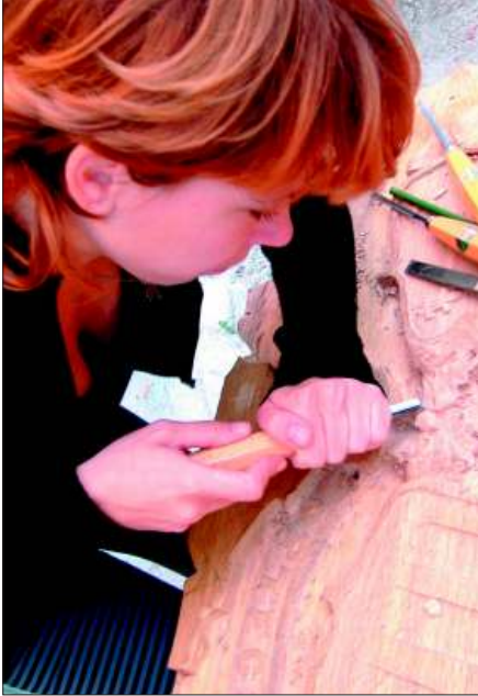
Talla de madera. 2004.

En el taller de talla se trabaja con la piedra y la madera principalmente, combinándose de forma natural hasta que el alumno se decanta por una de ellas como especialización básica.