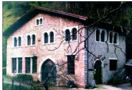
Edificio del actual Centro. Barrio Artzabal. Deba 2006.