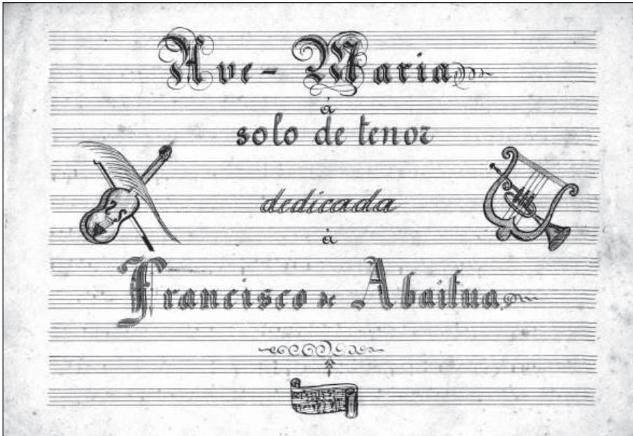
"Euskarazko ereziak" sailean argitaratutako "Ave Maria"ren aldaera. Iturria: Euskaltzaindia, ABA-RMA-014

- Kontrabaxurako: "1. Goizean Parisen", "2. Akerra ikusi degu", "4. Atea dizut kirrinkari", "5. Banabilazü", "6. Amets gozotan", "7. Auntxo gazte", "9. Ikustera", "10. Orai negu-txoriak", "11. Eztut nehoiz", "12. Andre emaztegai", "13. Aritz-adarrean", "14. Artamendiko lili", "15. Hemen eldu naiz", "16.