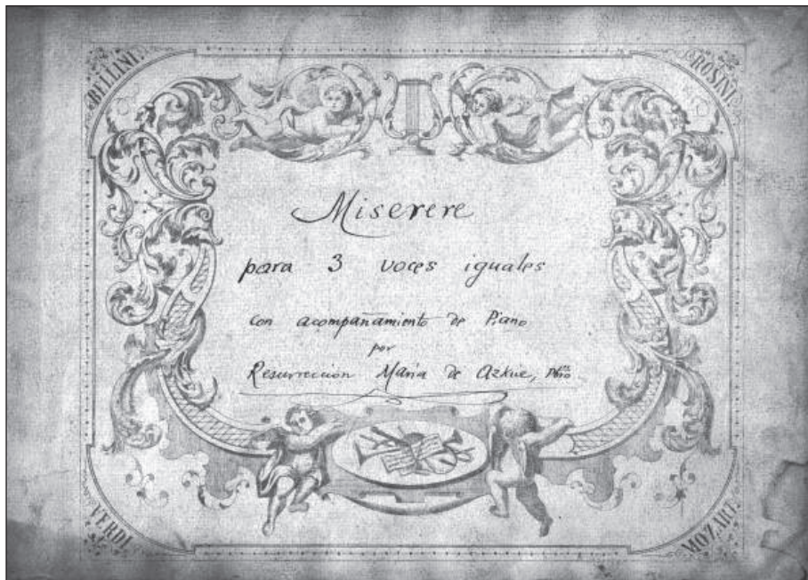
Azkueren lehengotariko konposizioa.