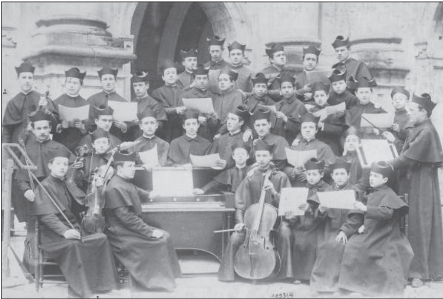
Salamancako Seminarioko Abesbatza eta Orkestra. Azkue zuzendaria eskuinean zutik agertzen da.