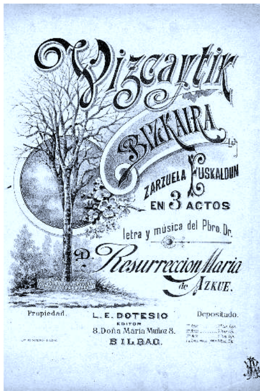
Bilbon 1895ean Dotesiok inprimatutako R.M. de Azkueren "Vizcaytik Bizkaira" euskal zarzuelaren partitura.