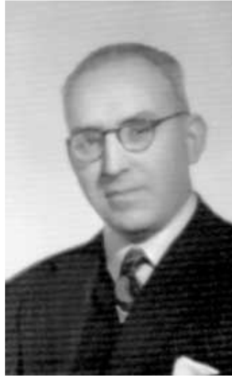
Argentinako lehen urteetako argazkia. Tandil, 1940-41.