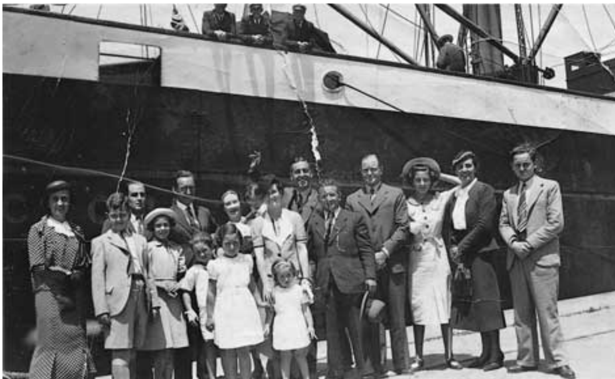
Garatetarrak gerraren ihesi Ameriketara iritsi zirenean, «Alcyone» itsasontzitik lurreratzean. Buenos Aires, 1937-12-10.

1938ko uztailaren 18an, Espainiako gerra hasi eta bi urtera hain zuzen, gaindituko du Argentinan medikuntzan aritzeko azterketa. Urte berean bigarren tesi bat ere aurkezten du: Glucopenias endógenas izenekoa. Eta lanari ekiteko, zein eta haurtzaroan