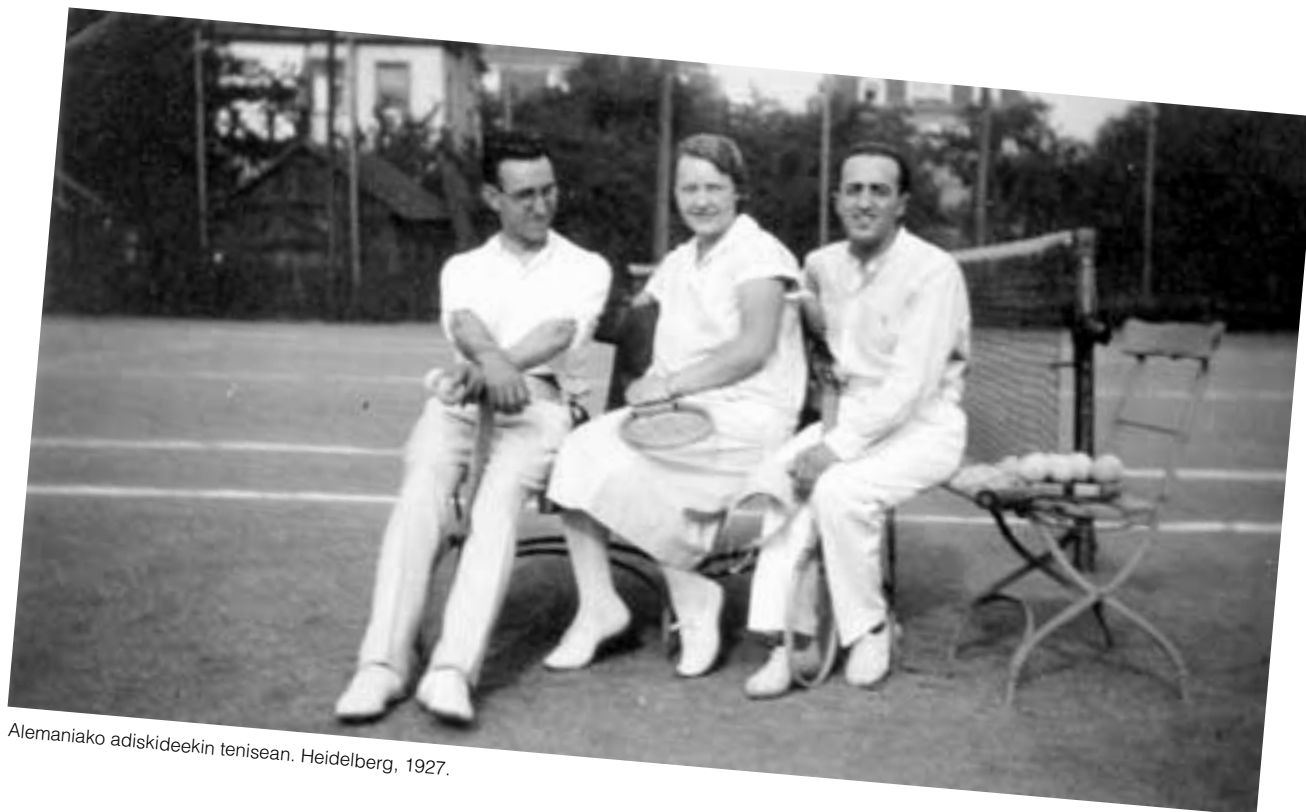
Alemaniano adiskideekin tenisean. Heidelberg, 1927.