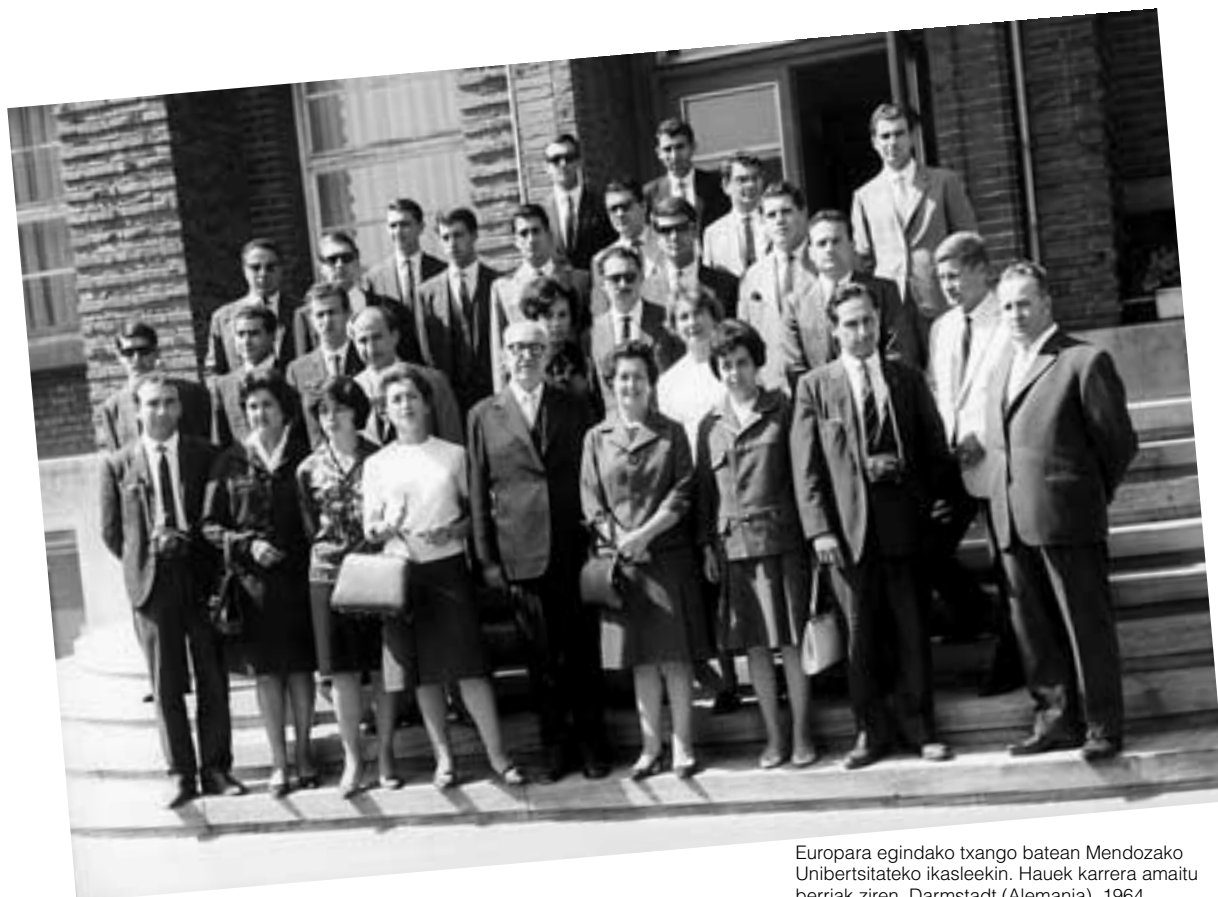
Europara egindako txango batean Mendozako Unibertsitateko ikasleekin. Hauek karrera amaitu berriak ziren. Darmstadt (Alemania), 1964.