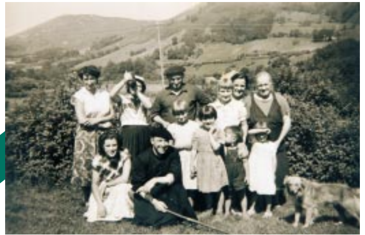
Hazparneko gazte-taldearekin Azkainera egindako ibilaldiaren argazkia, Piarresen aita eta amarekin