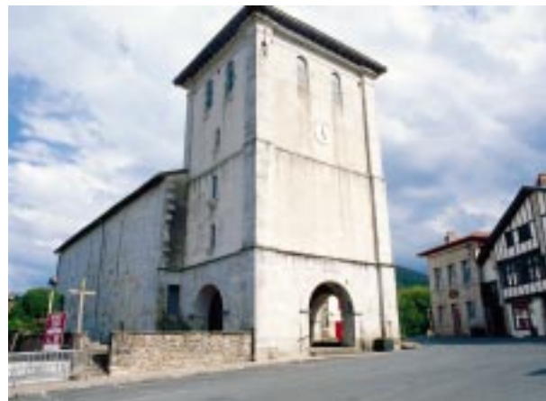
Azkaingo, Larzabalen sorterriko, eliza eta plaza