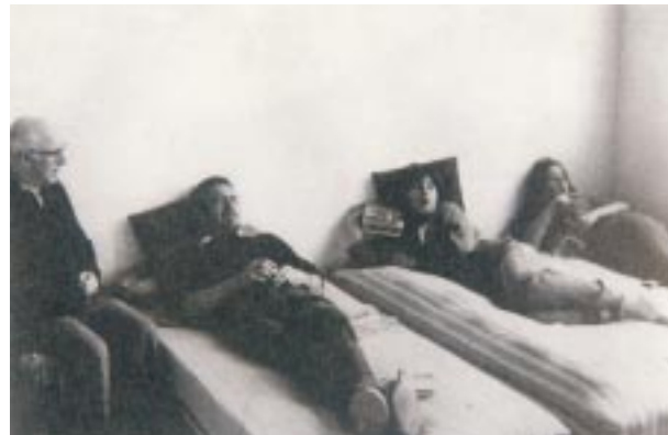
Zokoako elizan egindako gose-greba iheslarien alde