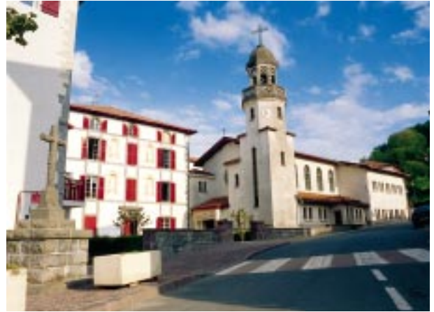
Hazparneko etxe honetan egin zituen apezetarako lehen ikasketak