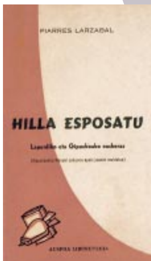
Matalas antzerkiaren berrargitarapena Eusko Jaurlaritzaren Antzerki aldizkarian. Hilla esposatu eta Bordaxuri Auspoa liburutegiak argitaratuak