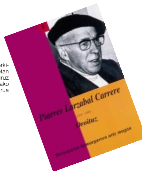
Azpeitiko Antzerki-topaketetan Larzabali buruz argitaratutako liburua

Bost urte luze joan ziren oraino eliza barneko lanak eta aldeko apez-etxe berria ezin bururatuz eta 1959an, azkenean, egin zen lehen bataioa eliza berrian, han berean ezarri sakramentu saildua eta apezak aldaira egin bere etxe berrira, etxe zaharra saldurik.