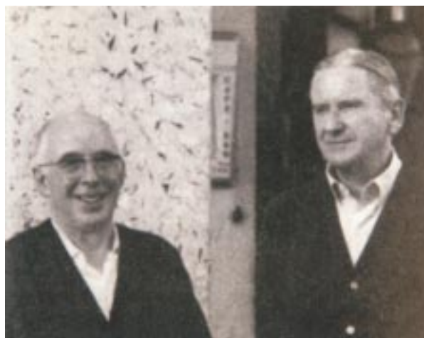
Monzonek eta Larzabalek elkarrekin egin zituzten antzerki, kantu eta lan asko

Azkenean pastorala gisako bizpalau ikusgarriren asmatzera ausartuko da: Lartaun , Aralar eta Orria adibidez; Oiartzungo, Donostiako edo Azkaingo talde batzuen buru dabiltzan adiskide batzuek bultzaturik beharbada.