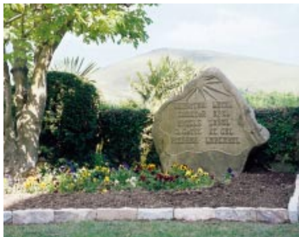
Azkaingo herriak bere seme ospetsuari ezarritako oroitarria

Bere bizian zenbait aipaldi, gisa guztietakoak, izanak zituen Zokoako erretore zenak, bere herritar maiteak uztean, nahi zuen, azken aldikotz, bere kristau-fedearen aitormena adierazi herriari eta gero, bere euskal herri sofituarentzat baitezpadako zeukan elizaren egiazko irakaspén zuzena oroitarazi, irakaspén hori ahantzi edo ez ikasi duten jende tipi eta handi guztien aitzinean. Eta bururatzen zuen bere azken predikua «Berritz elkar ikus arte!» hunkigarri bat erranez.