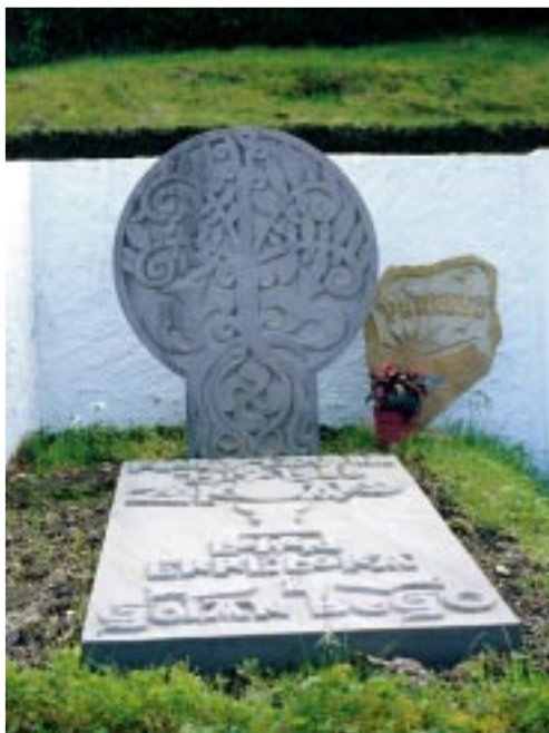
Zokoako hilarria, Larzabal ehortzi zuten lekuan