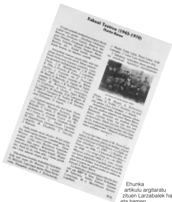
Ehunka artikulu argitaratu zituen Larzabalek han eta hemen