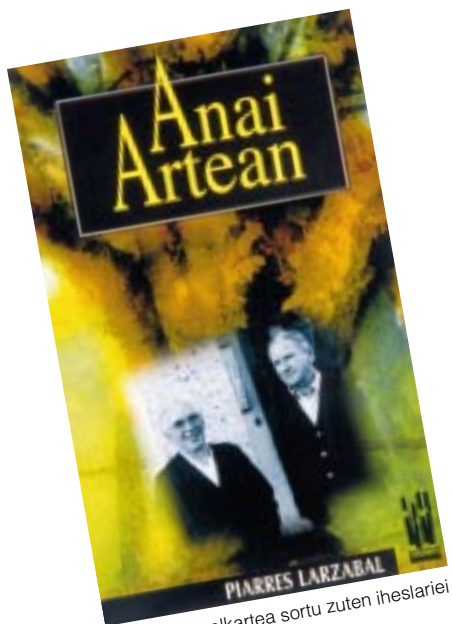
Anai Artean elkartea sortu zuten iheslariei laguntzeko

1960ko urte berean sortu zen Iparraldeko abertzaleen lehen aldizkaria eta alderdi politikoa: Enbata deitua. Sortzaileen artean apez bat bazen, hura Piarres Larzabal. Luzaz honek berak idatziko ditu astekariaren euskarazko zutabe nagusiak.