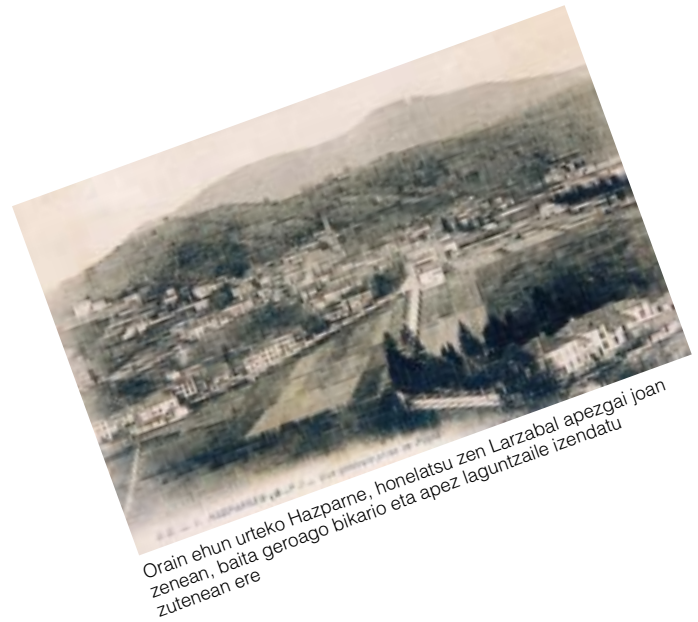
Orain ehun urteko Hazparne, honelatsu zen Larzabal apezgai joan zenean, baita geroago bikario eta apez laguntzaile izendatu zutenean ere