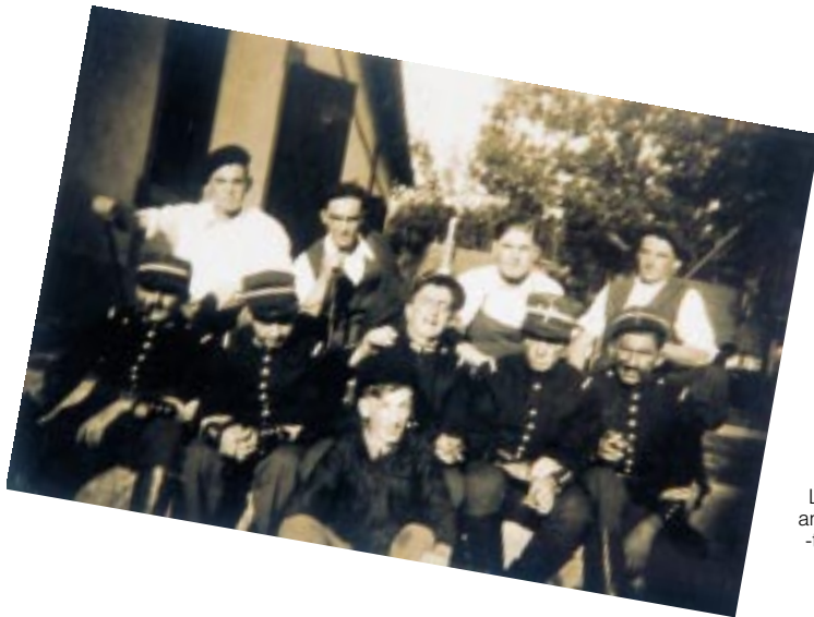
Lehen antzerki- taldea

Igande arrats batez, bestalde, bikarioen etxe ondo-ondoan tiroz hil zituzten batere funtsik gabe bi hazpandar gazte, alemanen baimenik gabe etxera buruz destenorez zebiltzalakoan.