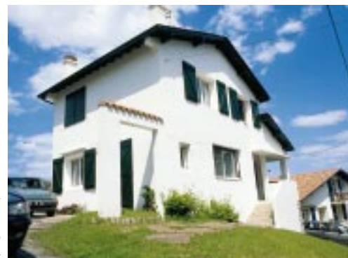
Larzabalek berak, auzolanean, eraikitako apezetxea