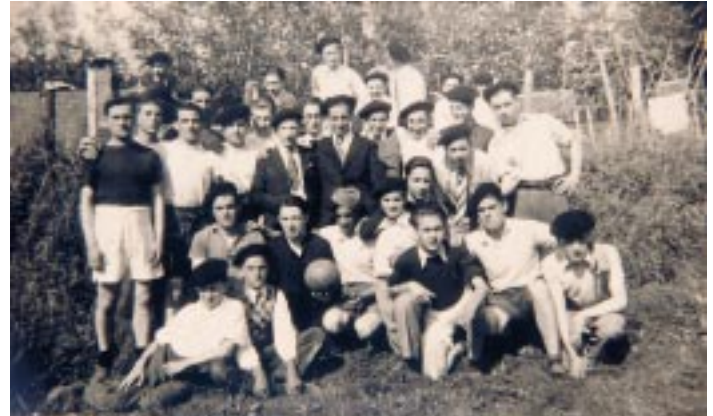
Hazparneko haurrekin futbol-taldean

Horrela badakigu beraz Alemaniako preso-zelai batean eri handi zelarik, Suitzako Gurutze Gorriaren ikuskari batzuei esker Suitzara eramán zutela eta gero, han ongi sendaturik, itzuli zela, 1942an, Lyonen gaindi, Hazparnen haren aiduru zegoen bikaritegira.