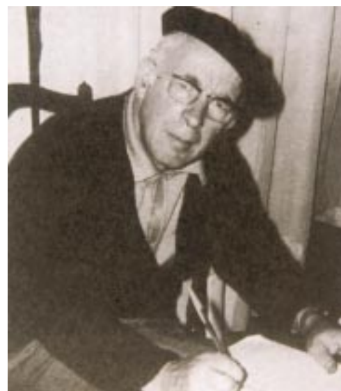
Larzabal bere oroitzenak idazten