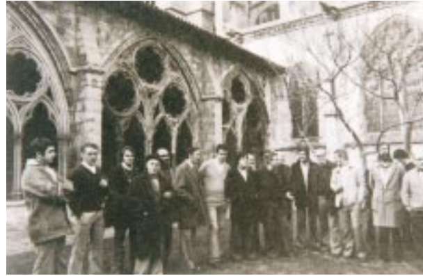
Baionako katedralean egindako gose-greba bateko taldea