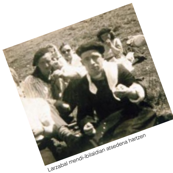
Larzabal mendi-ibilaldian atsedena hartzen