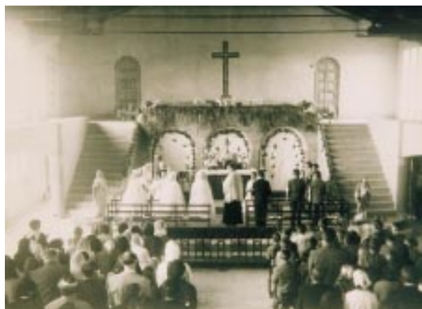
Zokoako elizan egindako lehen jaunartze-elizkizuna