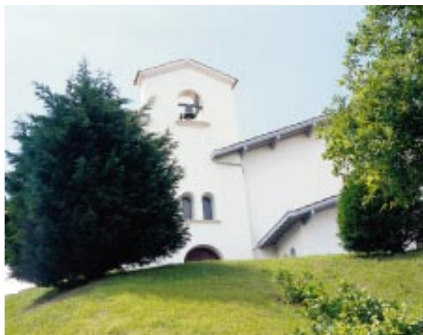
Zokoako eliza, Larzabalek auzolanean jasoa, iheslari bat baino gehiago ere aritu zen lanean

Gehiago oraino, so bat emaiten badiogu geroztik lau liburuki gotorretan bildu diren Larzabalen 50 bat antzerkiei, ohartzen gara ez dutela ez guztiek maila bera, ez funtsaren ez formaren aldetik, baina aldaketa handiak urtetik urtera nabari direla.