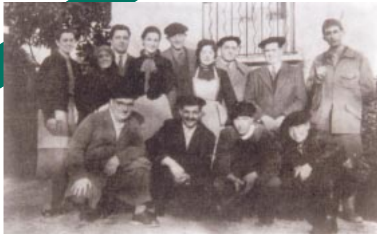
Herriko bozak plazaratu zuen taldea