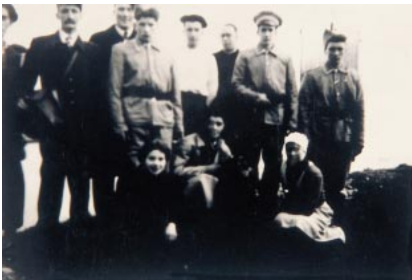
Basabeltz Urruñako antzezle-taldea

Irri eginarazteko xedea besterik ez dute hastapenean Hazparneko bikarioaren Kontrabandistak , Lau donadoak , Ferrando , Dendarietan , Manez ohoretan , Eiherazainaren astoak , ala Xirrixti-mirrixti antzezlanek. Baina laster antzerkigilea eta jokalaria