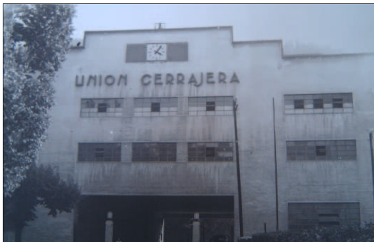
UCEM de Arasate. Entrada a la fábrica años 40. A.M.I.A.M.)

En definitiva, se trataba de una solución inteligente, armonizadora y unificadora, ante un grupo de edificios que se habían construido sin ningún tipo de ordenamiento urbanístico interno, según las necesidades productivas de las sucesivas etapas empresariales, generando espacios aparentemente anárquicos.