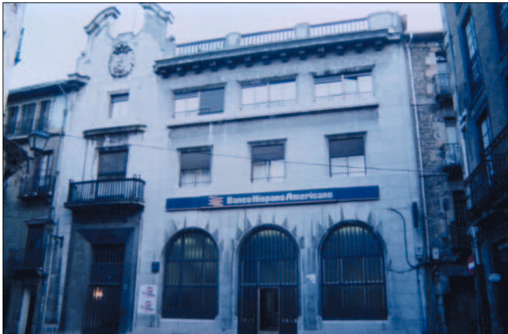
Edificio del Banco de San Sebastián en Bergara.

No obstante, podemos encontrar también con edificios en los que indaga nuevas vías de expresión como el del Banco de San Sebastián de Bergara (1941) 40 . La obra resulta totalmente original dentro del contexto de la época, mezcla entre el clasicismo, lo funcional y lo barroco. Sus tres arcos de medio punto de la planta baja y los vanos adintelados de los pisos superiores se podrían mantener dentro de las tendencias que combinan lo clásico y lo funcional, en el ámbito de lo academicista. Pero el frontón partido mixtilíneo del remate, a modo de espadaña, no tiene ninguna réplica, y convierte al edificio en una obra sorprendente.