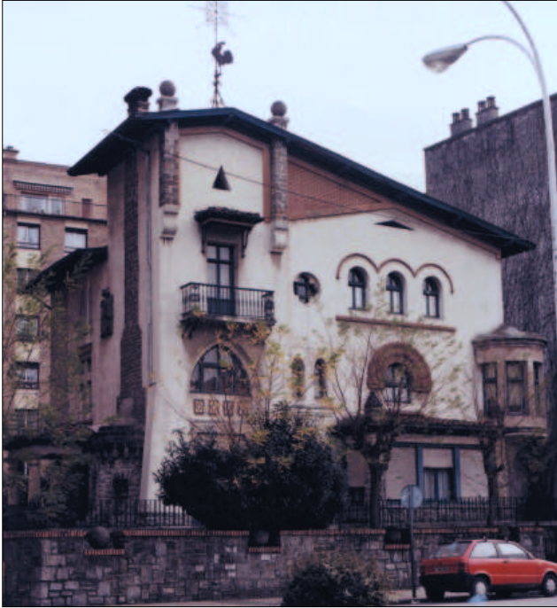
Eguzki alde-Elxea, Bergara. Hoy desaparecida.