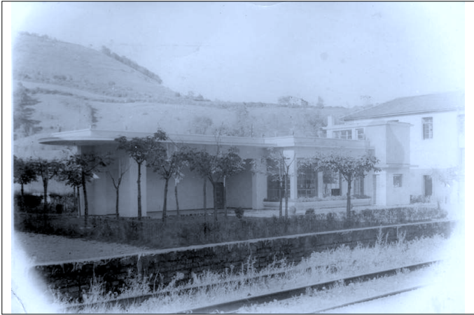
Eskola Txikia en Bergara. A.M.B.

Aunque se trata de una construcción de pequeñas dimensiones, resulta un bello edificio funcional, en conexión con las escuelas proyectadas por los arquitectos del primer movimiento moderno 27 .