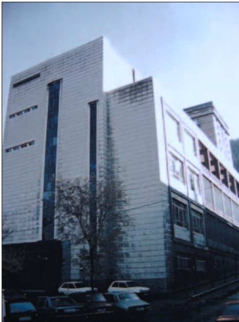
Escuelas de Primera Enseñanza e Iniciación Profesional de las RR. de la orden de la Compañía de María Nuestra Señora. Bergara

Los edificios de viviendas de finales de los 50 y principios de los 60, de promoción privada construidos tanto de Bergara, como de Donostia presentan una