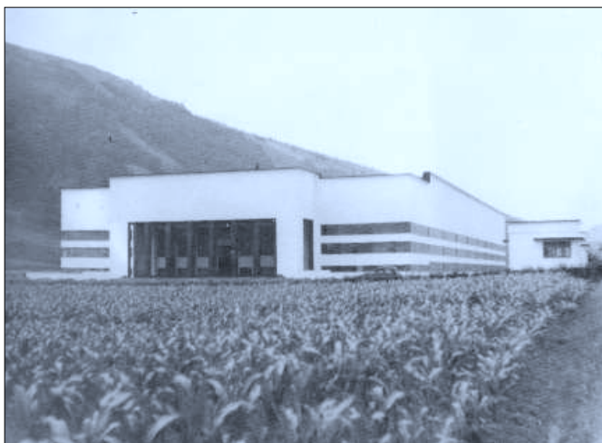
SACEM. Villabona. Años 40).

Pintado totalmente de blanco es un edificio de gran belleza formal. El juego de las líneas verticales del pórtico con las horizontales del cuerpo resulta magistral en su concepción. Muros, vanos y pilares como únicos elementos decorativos de este paralelepípedo cerrado que es el edificio de la fábrica. No obstante, en el techo del pórtico tras los pilares aparecen unos artesonados que rompen con esta línea moderna y apunta a elementos historicistas 30 .