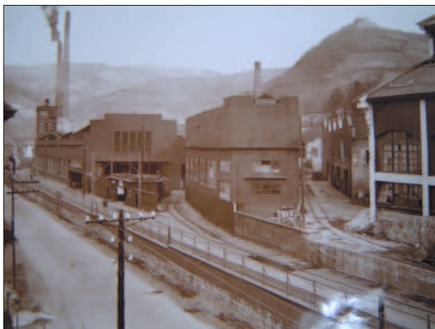
UCEM de Bergara. Años 40.

1945 proyecta pequeños edificios destinados a taller de reparaciones y garaje-cabinas para los vehículos de la fábrica. Son edificios de estructura de hormigón, con cubierta aterrazada, y vanos corridos y de líneas absolutamente sencillas y funcionales 26 .