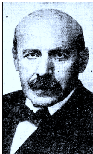
Ignacio Zuloaga.

En este sentido, poco se hizo esperar la respuesta encargada de desmentir esta noticia, la cual vino de la mano del Gobierno provisional