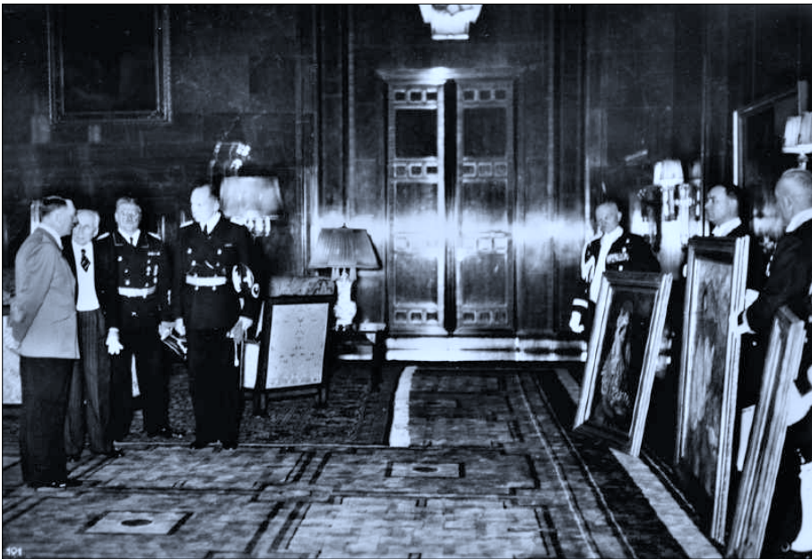
De izquierda a derecha: Adolf Hitler; Antonio Marques de Magaz, Otto Meissner y Paul Schmidt observan los tres cuadros de Zuloaga regalados por Franco a Hitler.

Un cuadro representa un granjero español en una escena pastoral. Los otros son unas mujeres españolas con trajes típicos 13 .