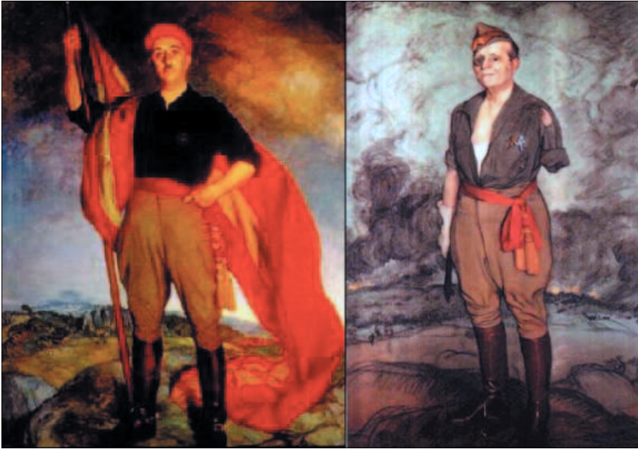
IGNACIO ZULOAGA: Retrato de Franco, 1940. Museo Nacional Centro de Arte Reina Sofía.