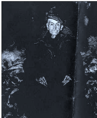
Ignacio Zuloaga. El requete más viejo de la guerra . 1938 Colección particular, Italia.

Para estas fechas, sus participaciones expositivas permiten comprender las acusaciones vertidas respecto a la obra de Zuloaga, tan personal, que es señalada bajo una intencionalidad política de creación y que realmente nada tiene que ver con ella. En cambio el uso que se da de su obra, normalmente mediante actos oficiales, si que contiene grandes elementos de propaganda político-fascista.